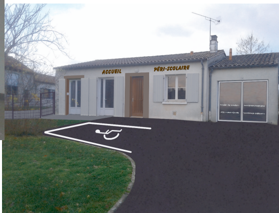
Image d'illustration de la façade