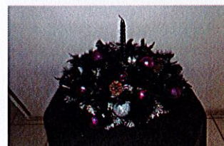
Centres de table