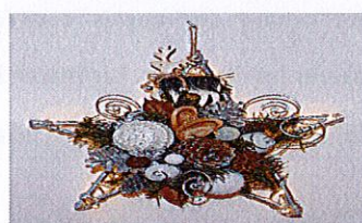
Etoiles à suspendre