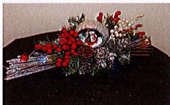
Gros fagots lumineux