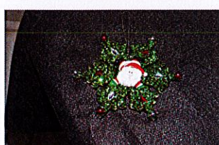
Décorations pour le sapin